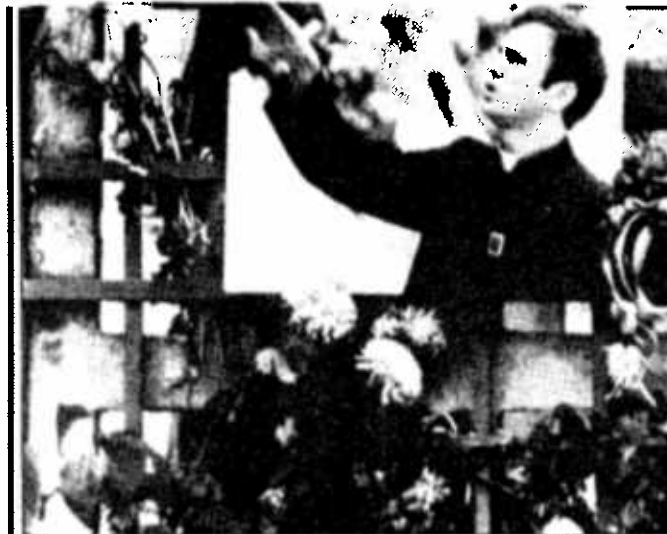
Toda Polonia llora la muerte del abate Popieluszko