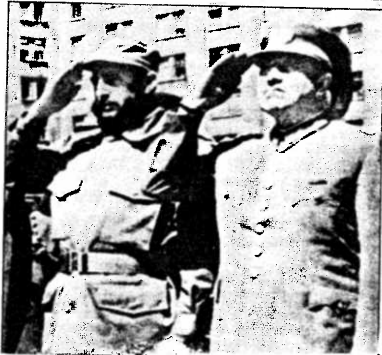
Pinochet, con Fidel Castro