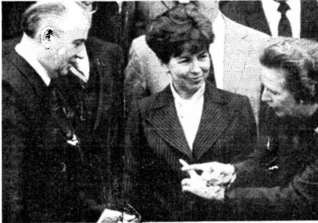
"La primera ministra Margaret Thatcher, conversa con Mikhail S. Gorbachev, miembro del Politburó Soviético. Los Conservadores se abrazan a los comunistas y la distensión Este/Oeste hace pedazos las esperanzas de una política fuerte de confrontación contra el totalitarismo.