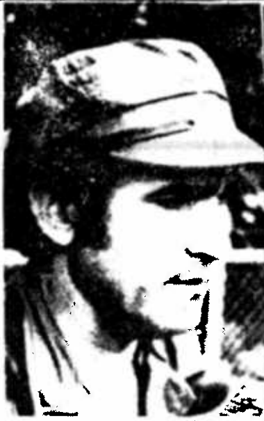
Edén Pastora, conocido como el "Comandante Cero"