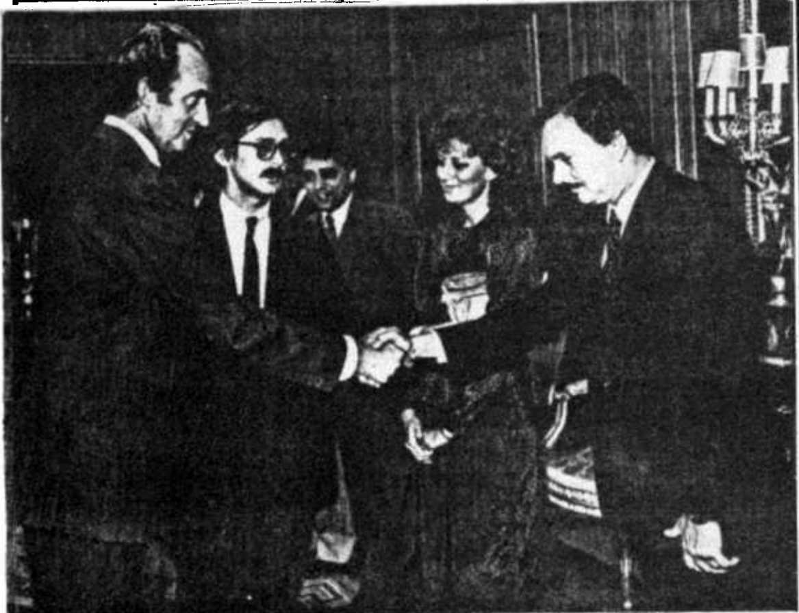
El Primer Secretario Nacional de la Agrupación Abdala en la recepción privada ofrecida por el Rey Juan Carlos I, de España, a dirigentes hispanoamericanos en Madrid.